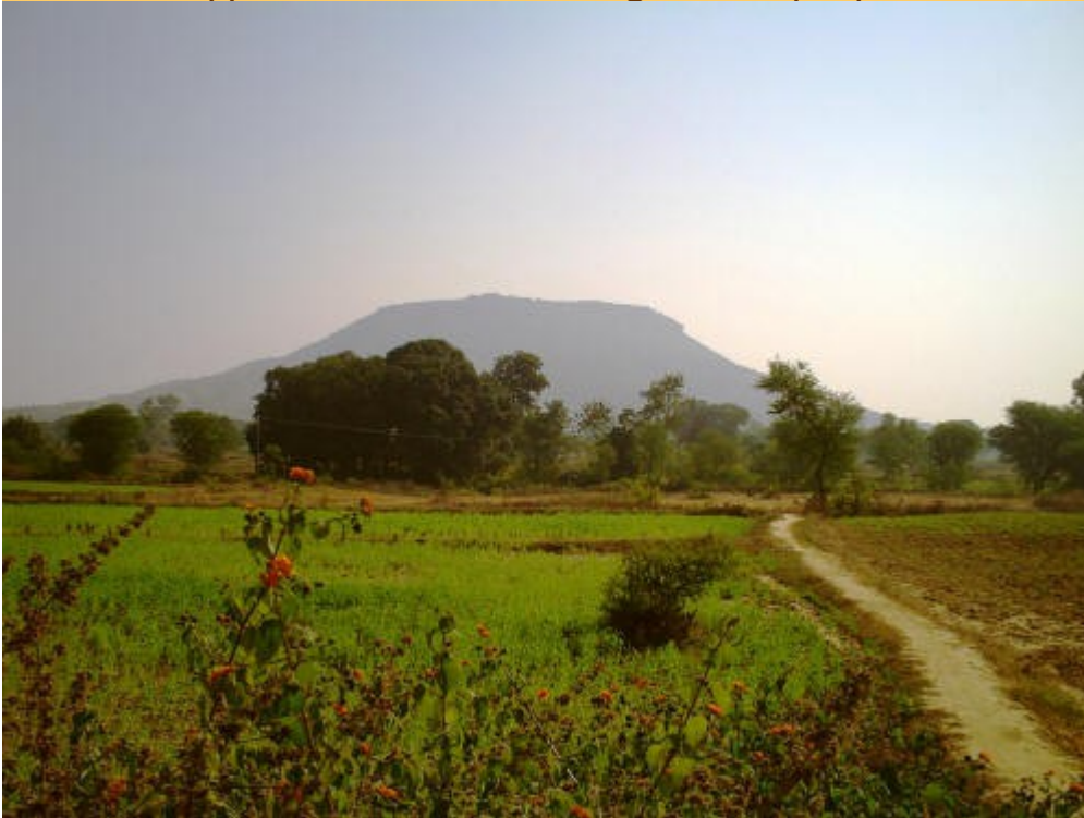
la Montagna Rossa. Un

destra, per una scorciatoia, il percorso che si faceva la più rimarcata delle cavedagne tra i campi insolitamente aperti, senza recinzioni di sorta, allora degli arativi o dei filari dei primi germogli di grano, mentre tra i fiori di * e le fronde degli alberi grandiosi, l'orizzonte appariva dominato dalla sagoma sempre più incombente del rilievo di Bharhut,