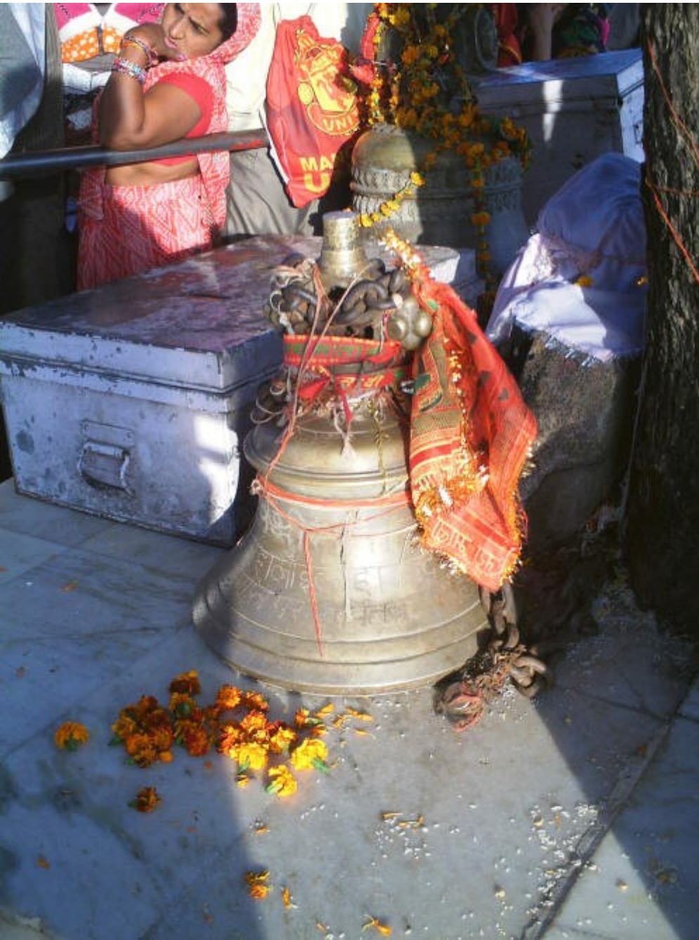
campane devoti cui si scorre di lato